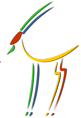
Turistička zajednica Istre