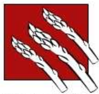
ruralna kuća za odmor